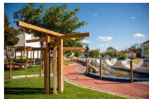
Jardim Sensorial da ASI